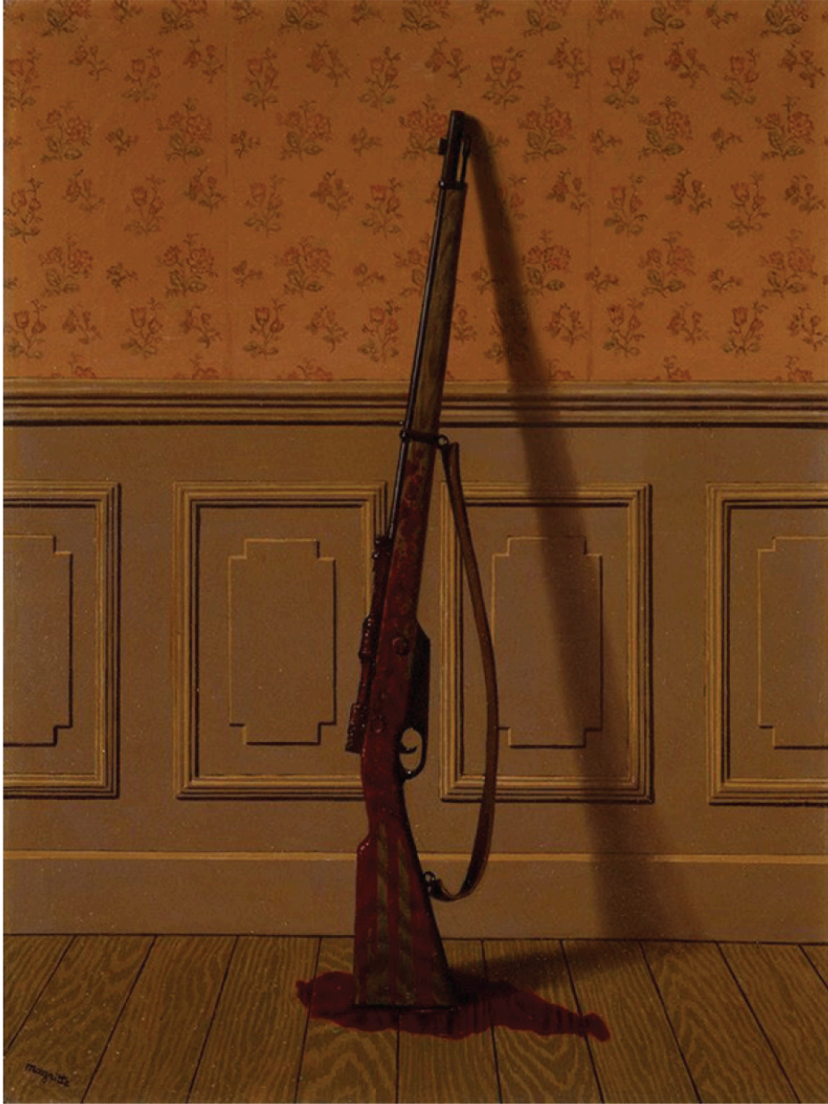
"الناجي" - رينيه ماغريت، ١٩٥٠